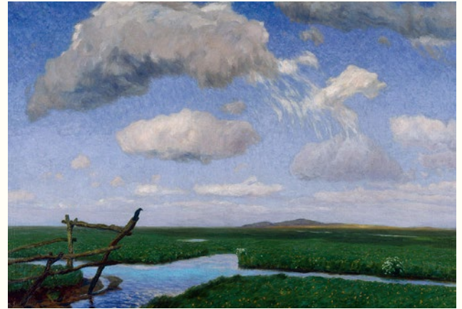
Fritz Overbeck, In den Wiesen, 1904