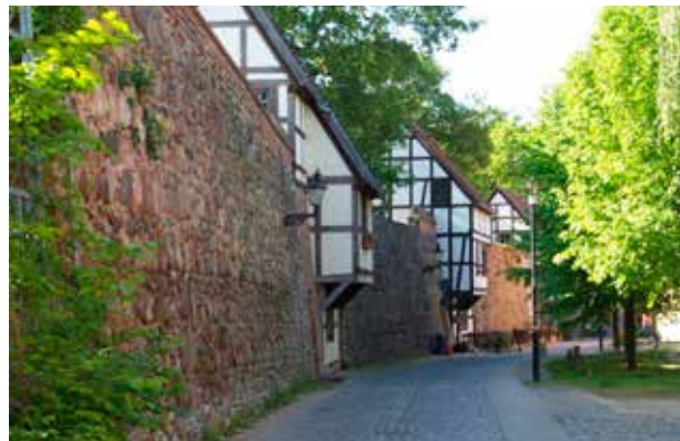
Wiekhäuser in der Stadtmauer

In Neubrandenburg lassen sich Natur und Kulturgenuss bestens vereinen. Genießen Sie Konzerte in Deutschlands aufregendster Konzertkirche und besuchen Sie Mecklenburgs ältestes Theatergebäude, das Schauspielhaus.