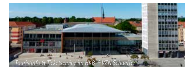
Touristinfo & Ticketservice im HKB