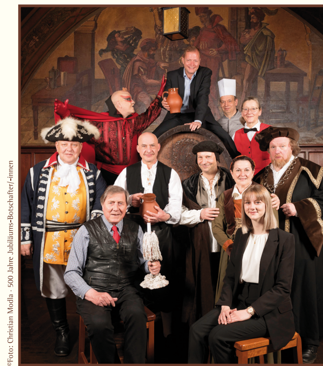
500 Jahre Jubiläums-Boischafter/-innen

Im Eingangsbereich zum Großen Keller befinden sich unser Souvenirladen und das Veranstaltungsbüro . Hier können Sie Besichtigungstouren und Tische reservieren sowie Ihre Veranstaltungstickets abholen oder auch Gutscheine erwerben.