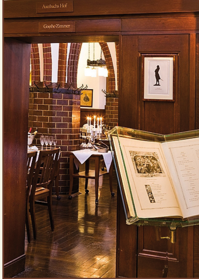
Historische Weinstuben - Blick ins Goethe-Zimmer

Großartiges Erbe, historischer Auftrag und gesellschaftlicher Mittelpunkt. Auerbachs Keller wird 500 Jahre alt! Dieses einzigartige Jubiläum möchten wir ab sofort mit Ihnen feiern. Einen kleinen Ausblick finden Sie hier: