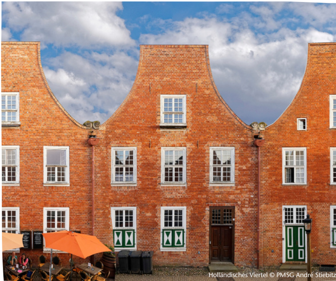
Holländisches Viertel