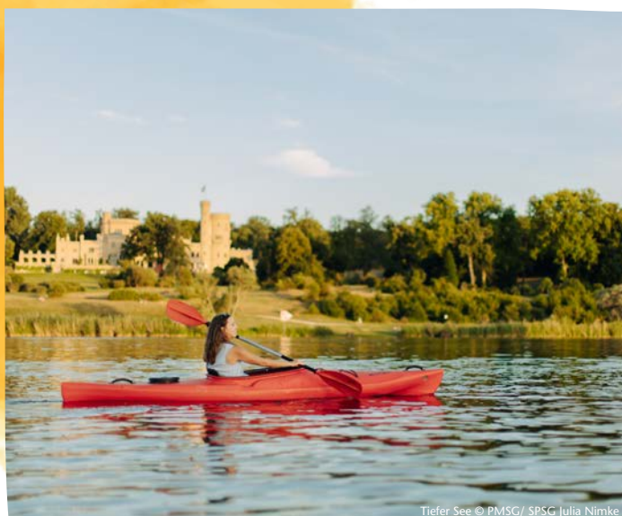
Tiefer See

Tipp Sie wollen selbst aktiv werden? Dann begeben Sie sich doch auf eine Paddeltour und bestimmen Sie Ihr eigenes Tempo!