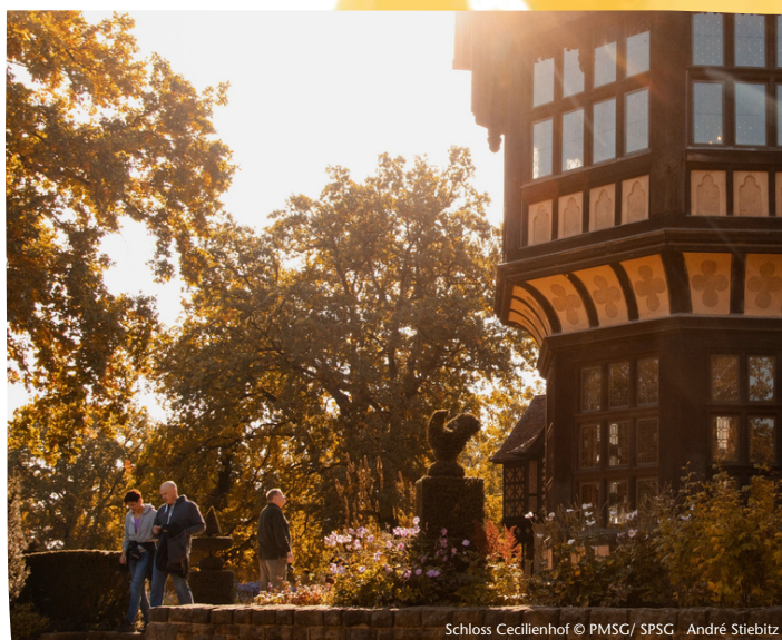
Schloss Cecilienhof