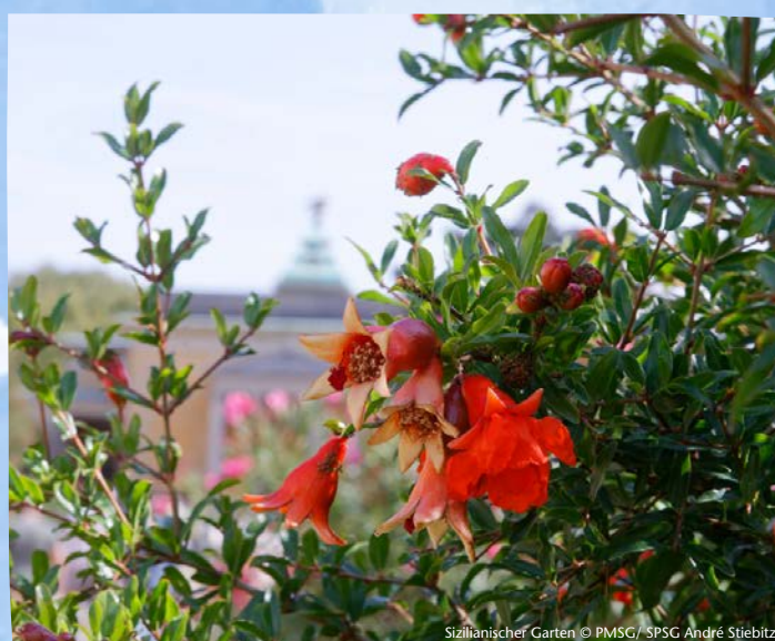
Sizilianischer Garten

Dauer 2 Stunden Buchbar ganzjährig Gruppenpreis (bis 20 Personen) 130€