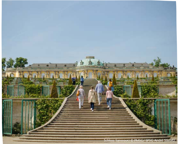
Schloss Sanssouci

Dauer 2,5 Stunden Buchbar ganzjährig Gruppenpreis (bis 40 Personen) 150€