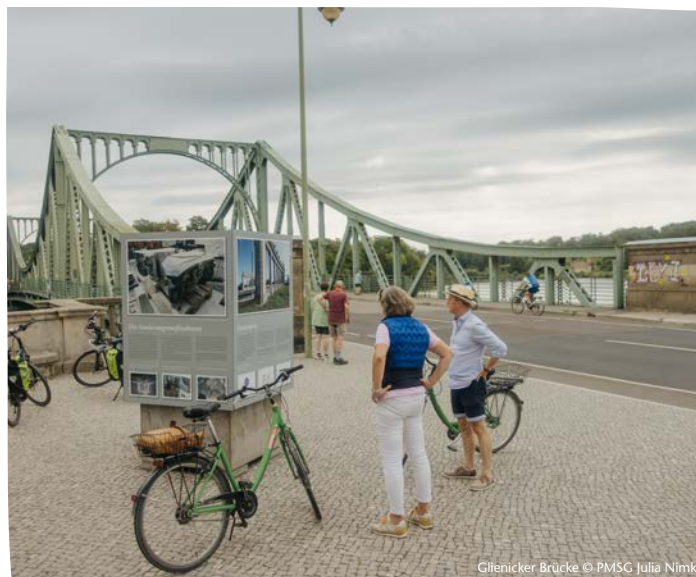
Glienicker Brücke