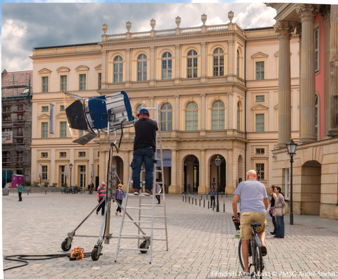
Filmset Alter Markt