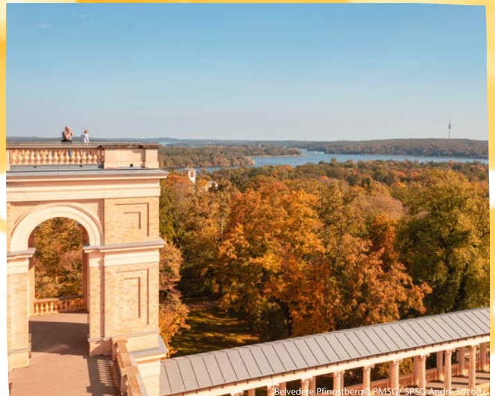
Belvedere Pfingstberg

Dauer 1 Stunden Buchbar ganzjährig Gruppenpreis (bis 20 Personen) 110€