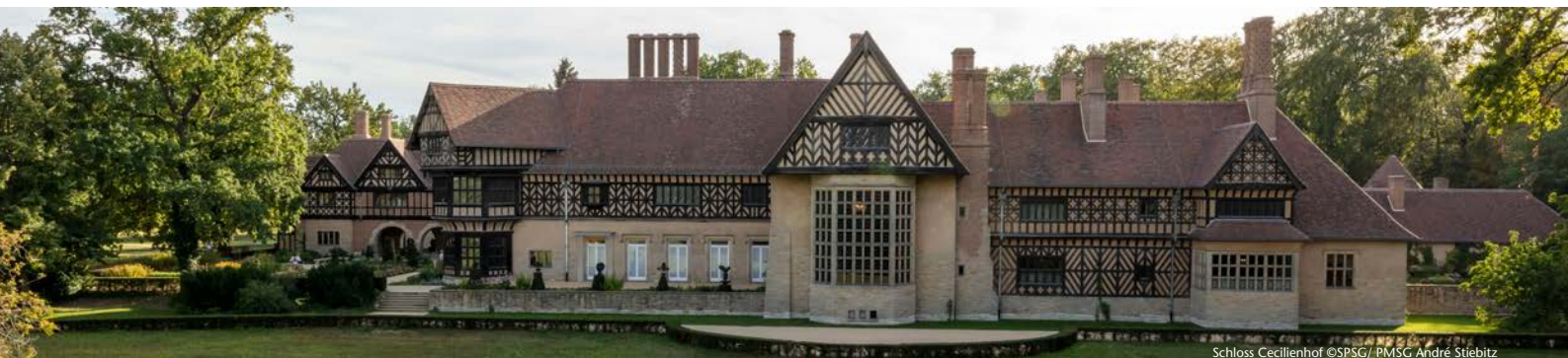
Schloss Cecilienhof