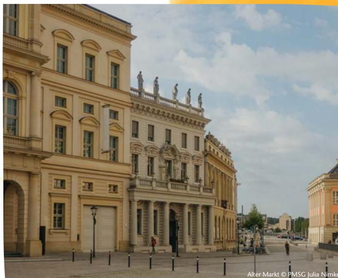
Alter Markt

Sie haben keine Zeit für einen eigenen Besuch in Potsdam? Dann lauschen Sie doch unseren Geschichten im Dein Potsdam-Podcast. Anne und Alexandra plaudern in der ersten Episode der 8. Staffel über das erlebbare Europa in Potsdam. Doch Achtung: Reinhören könnte Reisesehnsüchte wecken!